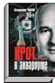
Владимир Чиков. Крот в аквариуме. — М.: Детектив Пресс, 2013. — 421 с. — 1500 экз.

Автор книги работал в одном из оперативных отделов ведущего контрразведывательного органа страны — Второго главного управления КГБ СССР. По роду деятельности он имел непосредственное отношение к выявлению действовавших на территории СССР агентов иностранных разведок. Владея информацией не из вторых рук и не понаслышке, он предельно объективно изложил в своей книге события, связанные с обстоятельствами разоблачения одного из самых изощрённых и коварных предателей в истории отечественных спецслужб — генерал-майора Главного разведывательного управления Генерального штаба Вооружённых Сил СССР Дмитрия Полякова.