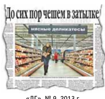
«ЛГ», № 9, 2013 г.