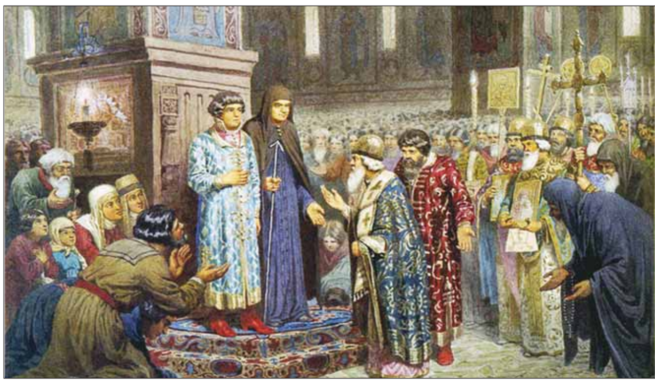
Алексей Кившенко. Избрание на царство Михаила Фёдоровича Романова. 1880 год

Этой-то «природности» и не хватало Романовым следующих поколений. Ведь последним представителем мужской ветви рода Романовых был Пётр III, убитый в 1762 году фаворитами своей жены. Недаром именно Петром III и провозглашал себя Емельян Пугачёв, что нашло весьма живой отклик в народе. Мне кажется, такую «природность» мы до сих пор ищем и в нынешних наших руководителях. Эту народную черту нельзя безнаказано игнорировать.