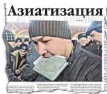
«ЛГ», № 10-11, 2013 г.

Рывок к современной западной цивилизации, под знаком которого прошли 80-е и 90-е годы, обернулся всё сильнее набирающей силу «азиатчиной», проникающей и в наш быт, и в систему политических институтов, влияющей на общий культурный и нравственный климат нашего общества.