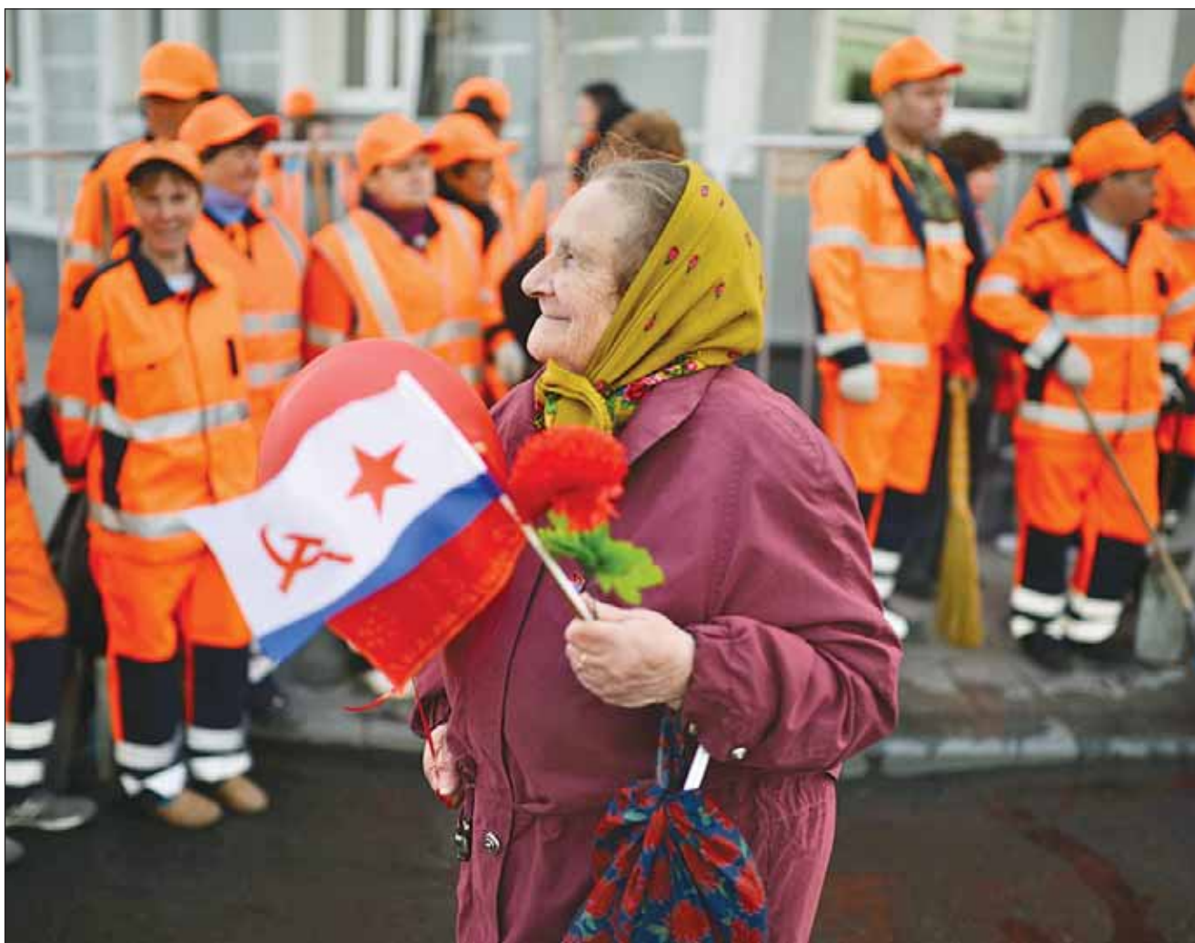
Вдоль по Питерской, по Тверской-Ямской...

Если ослаблены позиции русских в России, автоматически ослабевают позиции России в мире. «Азиатизация» давно превратилась из огромной внутрироссийской проблемы в не менее огромную внешнеполитическую. И оттого, что власти и СМИ эту проблему от нас долго скрывали, она несколько меньше не становится.