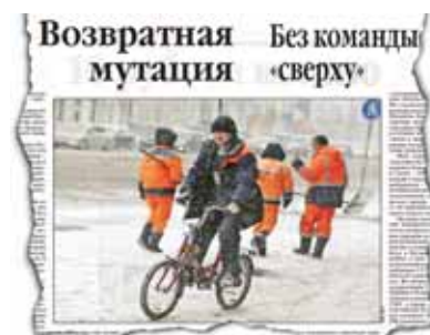
«ЛГ», № 15, 2013 г.

Скорее всего, это оно будет приспосабливаться к ним, приезжим, забывая свои собственные традиции, свою культуру.