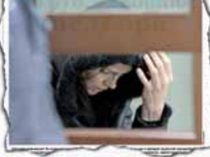
«ЛГ», № 45, 2012 г.